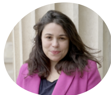
Léa Balage Députée

Enfant de Bègles, je dois mon engagement au service de l'intérêt général à ma ville, à ses services publics qui m'ont ouvert les portes de la citoyenneté, de la culture et de la solidarité. Du Conseil municipal des jeunes à l'Assemblée nationale, je dois tout à Bègles. Pour tous les enfants de Bègles, c'est Clément Rossignol Puech qu'il nous faut !