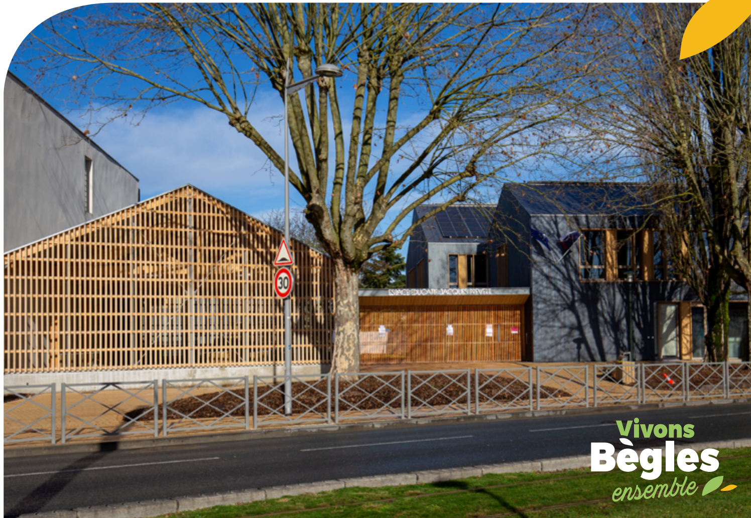
Le groupe scolaire Jacques Prévert, dans le quartier Birambits, sera livré au printemps